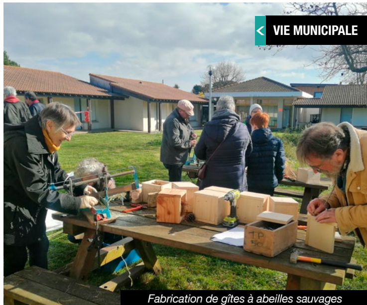
Fabrication de gîtes à abeilles sauvages