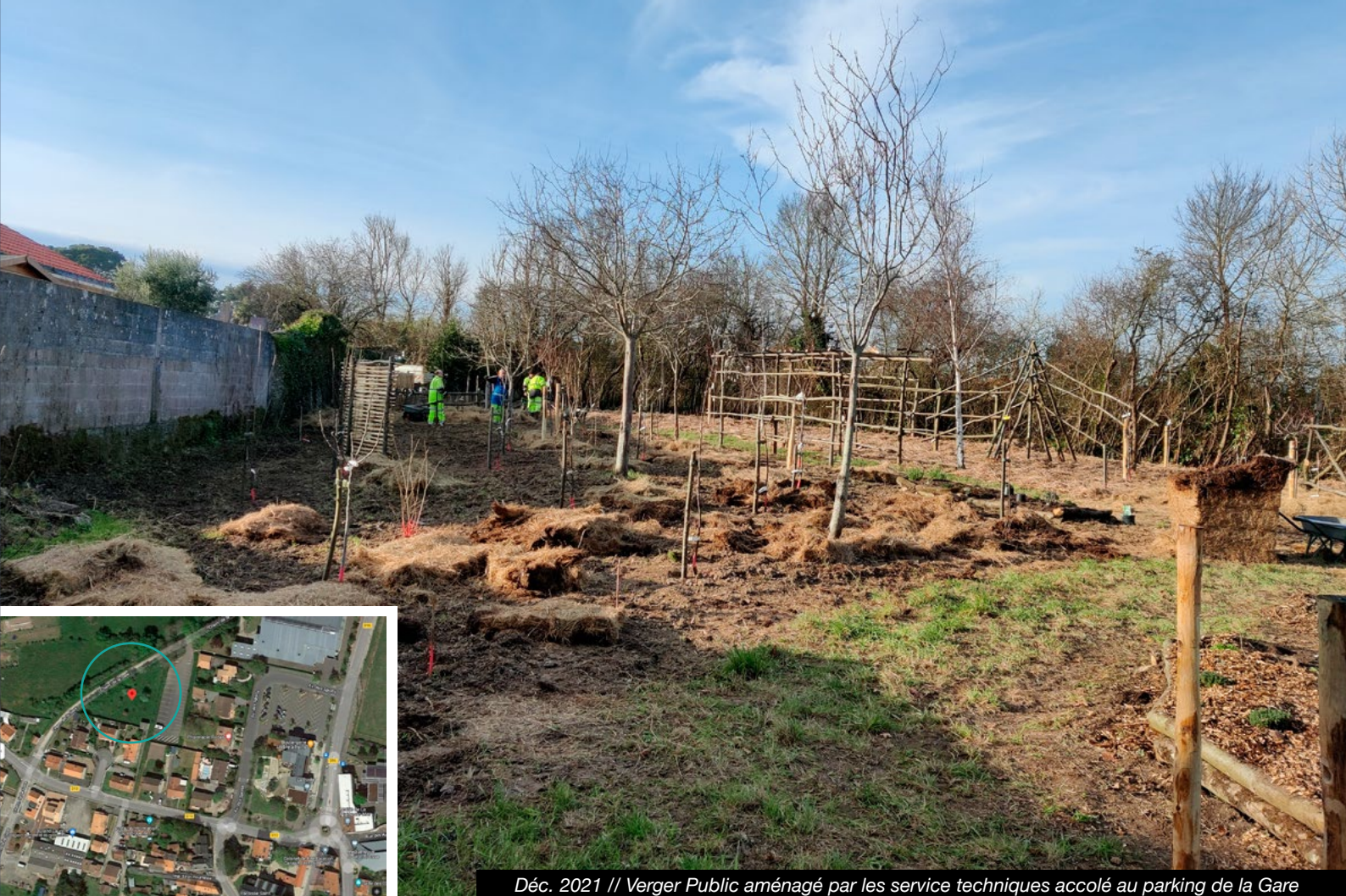
Déc. 2021 // Verger Public aménagé par les service techniques accolé au parking de la Gare