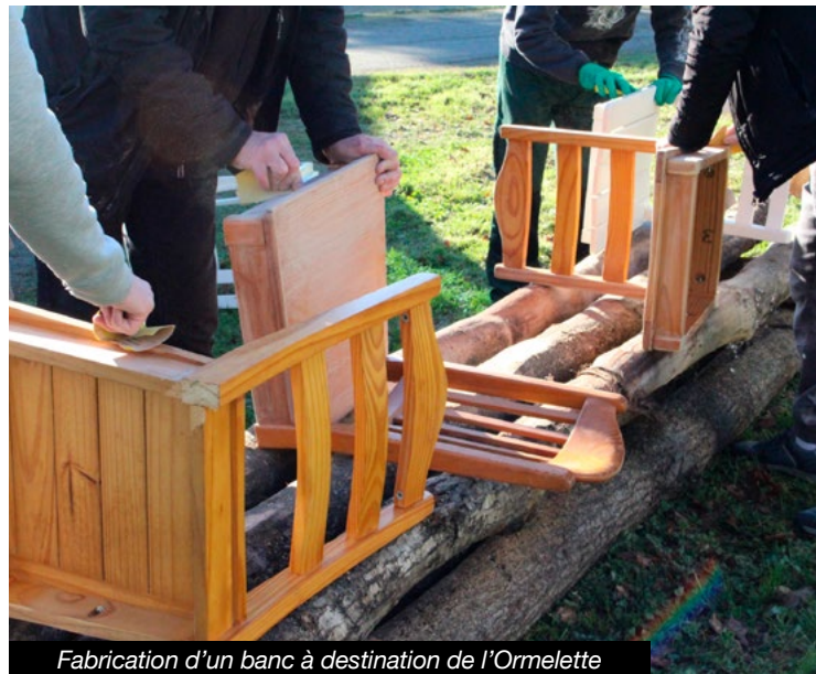
Fabrication d'un banc à destination de l'Ormelette