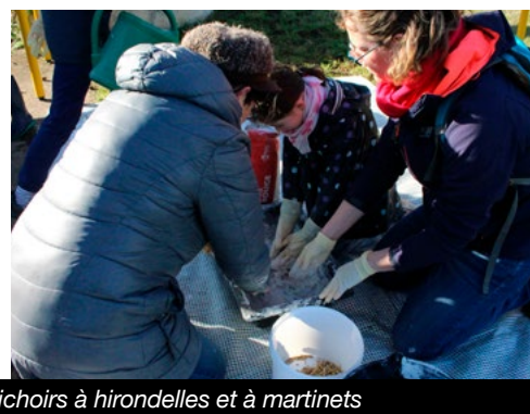
Fabrication de nichoirs à hirondelles et à martinets