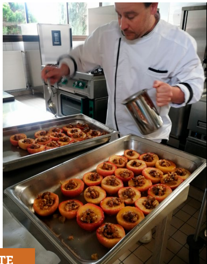
Élaboration du TUFABIJA

Pour faire écho à la thématique 2022 du festival Errances qui se déroulait en parallèle sur la commune, les enfants ont donc pu profiter d'un repas original, imaginé par les équipes du restaurant scolaire. Au menu : salade Pršut (son nom tient du prosciutto qui est accompagné ici de mâche et de tomates), suivi d'un goulash de bœuf et ses frites de polenta. Une belle découverte pour les enfants avec ces frites originales ! Pour le dessert, direction la Bosnie avec un tufahija, un dessert à base de pommes farcies d'un mélange de dattes, figues, amandes, noisettes et raisins, le tout nappé d'un coulis de miel et caramel.