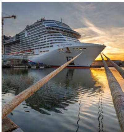
Du 8 au 30 janvier // “LES GÉANTS DE SAINT NAZAIRE” Photos de Yves Leroy

Ouvert les mardis, mercredis et vendredis de 9h30 à 12h30 et de 13h30 à 17h30, les jeudis de 9h30 à 12h30 et les samedis de 9h00 à 13h00.