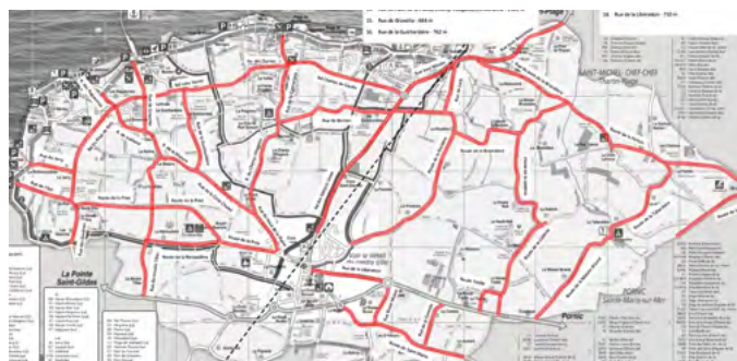
PLAN RAMASSAGE DES DÉCHETS DE LA VOIRIE 35 KM