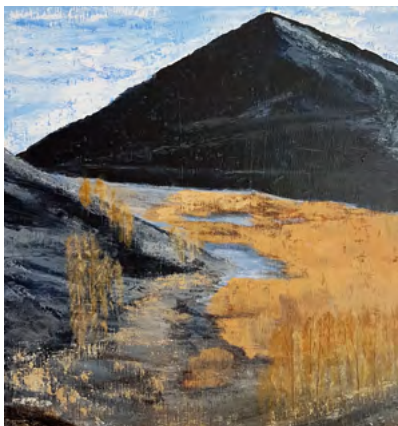
du 4 février au 1 er mars // “AU FIL DE L'EAU” Peintures de Catherine HUGUET