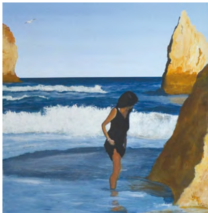
Du 30 mai au 28 juin // "PLAGE ET OCÉAN" Peintures de DAGUAIS