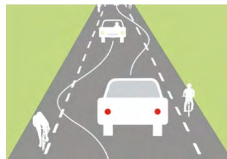
Comment circuler sur une Chaussée à Voie Centrale Banalisée

Les véhicules motorisés circulent sur la voie centrale bidirectionnelle et les cyclistes ou les piétons sur les accotements revêtus appelés rives. Ces rives ne sont pas des bandes cyclables et peuvent donc, en cas de besoin, être chevauchées par les véhicules motorisés.