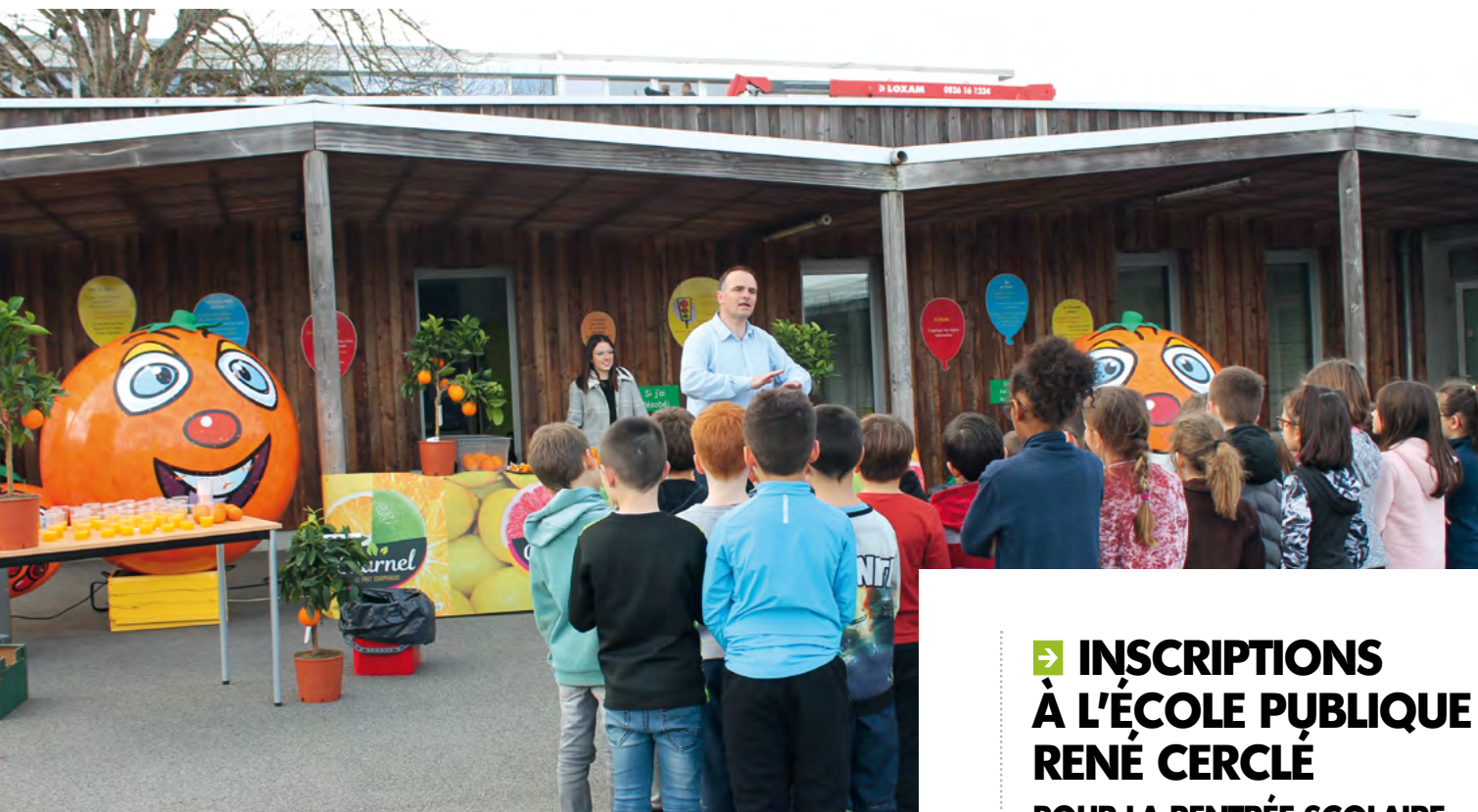
ANIMATION À L'ÉCOLE RENÉ CERCLÉ