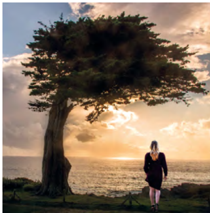
Jusqu'au 27 mai // "RÊVE & CONTRE-JOURS" Photos d' Alain SENSE

DU MARDI AU SAMEDI : 9H30/12H30 ET 14H30/18H