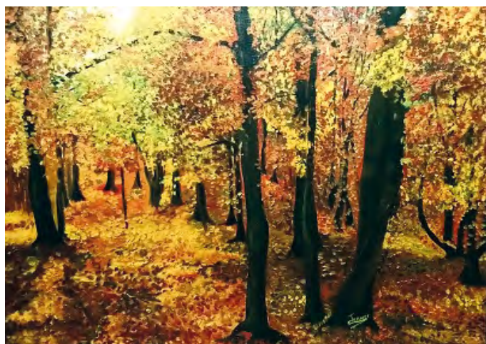
Du 13 mars au 11 avril // DÉCOUVRONS LA NATURE // Peintures de Sylvaine TERNET

OUVERT MARDI, MERCREDI ET VENDREDI DE 9H30-12H30 / 13H30-17H30, JEUDI DE 9H30 À 12H30 ET LE SAMEDI DE 9H00 À 13H00