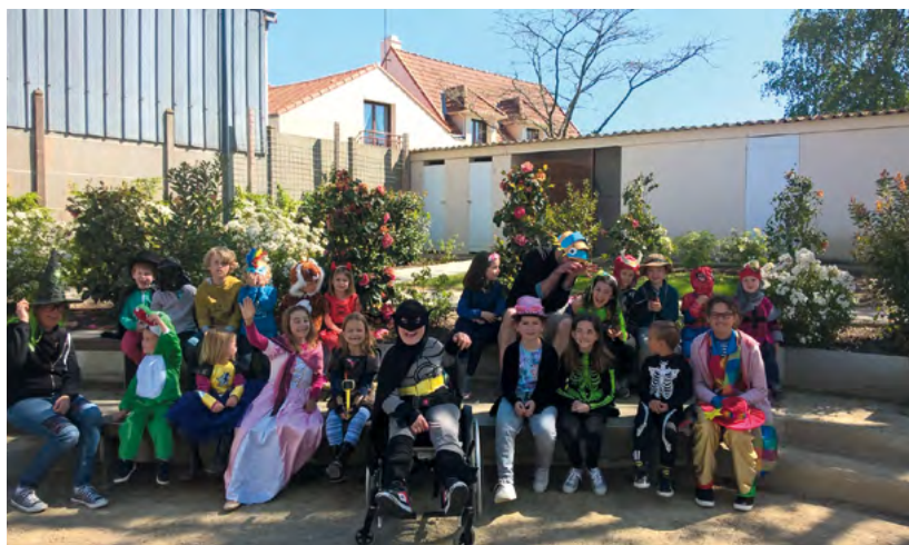
CARNAVAL ORGANISÉ PAR L'ACCUEIL DE LOISIRS

La priorité est que l'Accueil de loisirs soit un lieu réellement différent de l'école et de la maison. On y fait se rencontrer les enfants des deux écoles de la commune ainsi que d'autres enfants (en vacances dans la commune ou des communes voisines). Ils peuvent y vivre ensemble des activités toujours ludiques qui répondent à leur besoin de bouger, de découvrir, de choisir, d'être curieux. Le rythme des journées s'adapte aux enfants et le temps passé doit être un temps de détente et de plaisir. En amont des vacances et des mercredis, les animateurs préparent un programme d'activités et des projets qui abordent sous forme de jeux, d'ateliers ou de sorties des thèmes liés à la culture, l'art ou le sport. L'équipe d'animation rassemble tous les moyens nécessaires pour réaliser de petites et de grandes choses. Les parents peuvent suivre au jour le jour les activités de leur enfant et échanger le soir avec l'animateur. Au quotidien, tout est mis