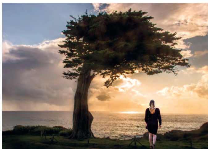
Du 14 avril au 27 mai // RÊVE & CONTRE-JOURS // Photos d' Alain SENSE