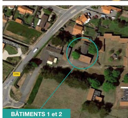
BÂTIMENTS 1 et 2