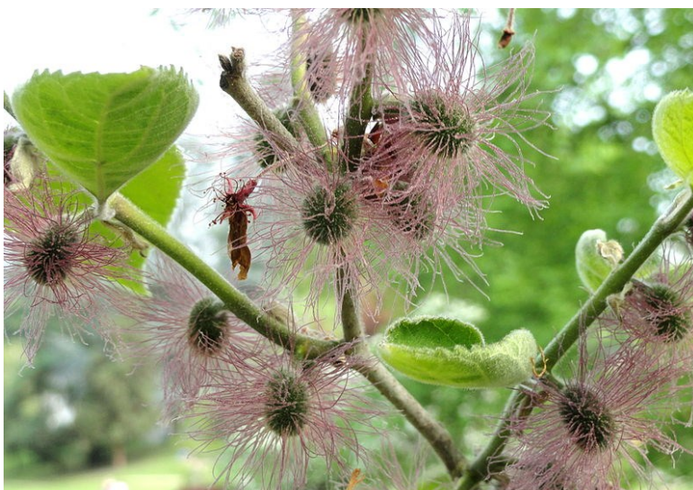
Flours femelles du Mûrier à papier

• Flours : Flours mâles blanc-jaunâtre, formant des chatons de 3,5-7,5 cm de long ; flours femelles en capitules globuleux de 1,3 cm de diamètre. Floraison en avril-mai.