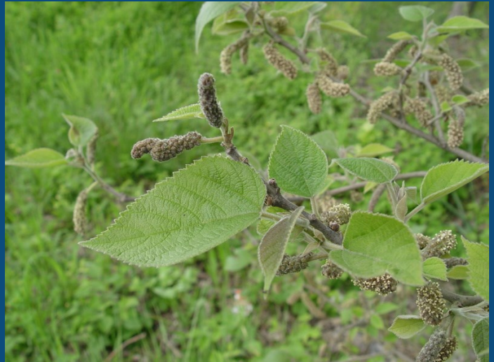
Aperçu des feuilles et des inflorescences mâles du Mûrier à papier © Molina James

C'est une espèce d'arbre dioïque à reproduction sexuée