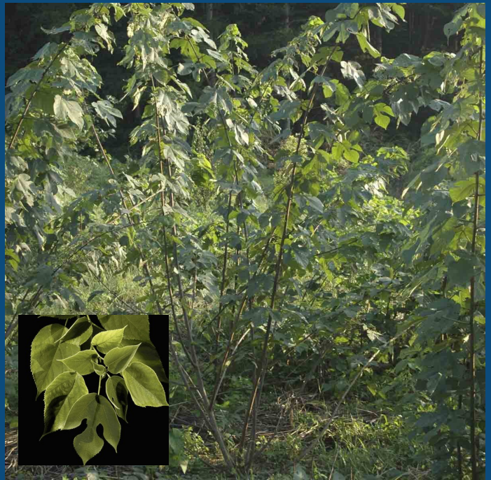
Mûrier à papier : arbre adulte et détail de son feuillage

Attention : le bois du Mûrier à papier est très tendre. Il est absolument déconseillé aux enfants de grimper dans cet arbre car les branches cassent facilement.