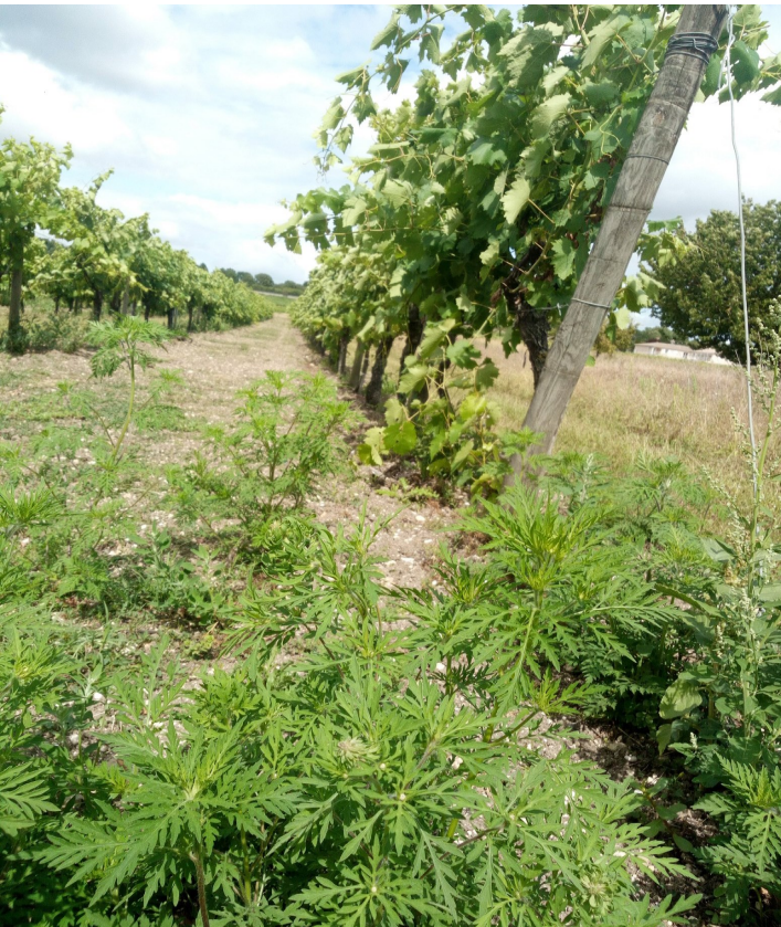
Ambroisie à feuilles d'armoise en vigne : ne pas se laisser déborder afin d'éviter toute exposition aux risques d'allergie lors des vendanges

✍ Ce foyer se situe en parcelle de vigne. C'est le premier identifié en Pays de la Loire (sans que ce soit le seul). Et cela peut poser un problème car il s'avère que la floraison de l'Ambroisie commence en août pour se terminer en octobre. Cela couvre le mois de septembre, période des vendanges en général. Et dans le cas de vendanges manuelles, l'exposition aux risques augmente.