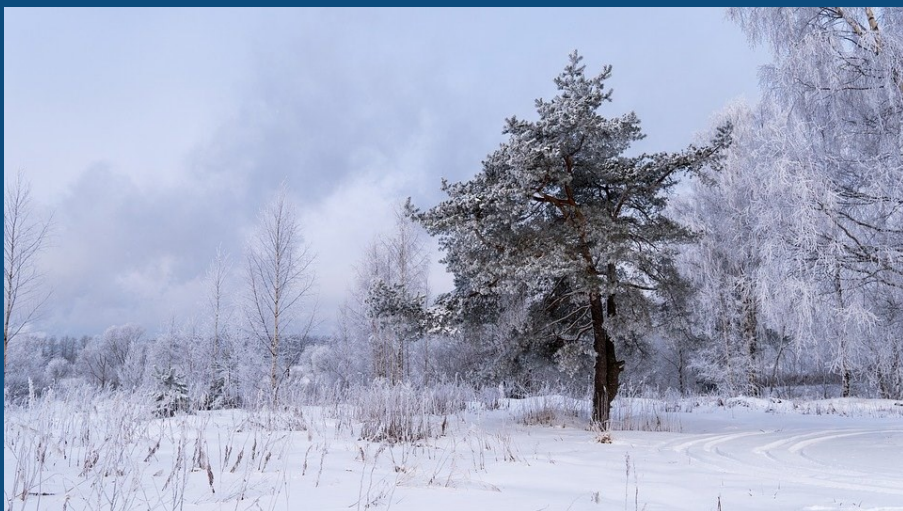
Aurons-nous toujours des hivers enneigés pour Noël ?