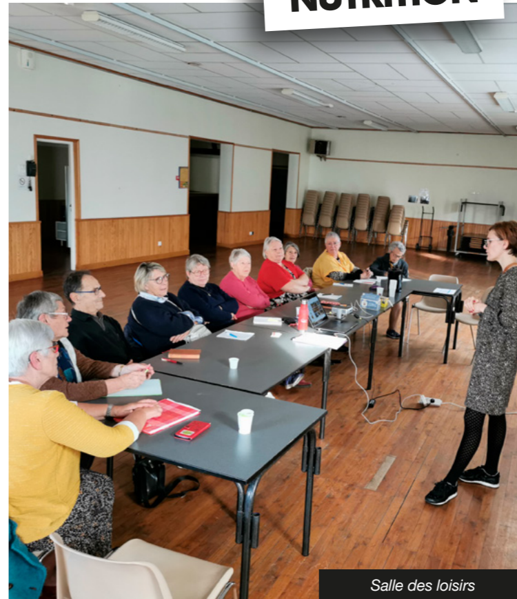
Salle des loisirs