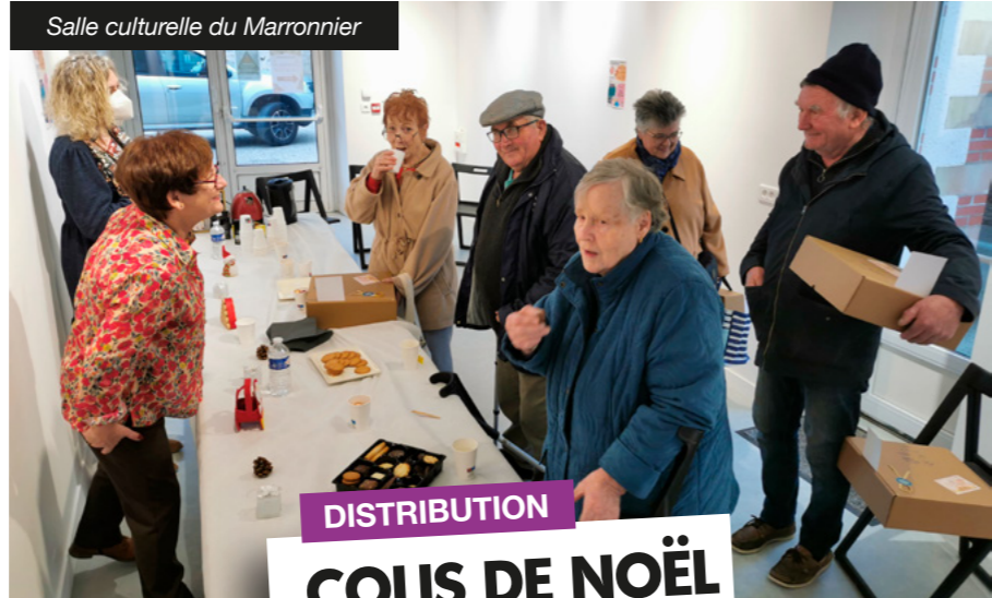
Salle culturelle du Marronnier

Chacun est reparti rassuré et mieux préparé à affronter d'éventuelles situations d'urgence. « Ces gestes simples peuvent vraiment faire la différence », a souligné l'une des participantes, visiblement satisfaite de cette formation. Un petit livret qui reprend l'ensemble des conduites à tenir et les gestes de 1er secours a été remis à l'issue de la formation.