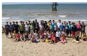
Échange scolaire : Bienvenue à la mer !