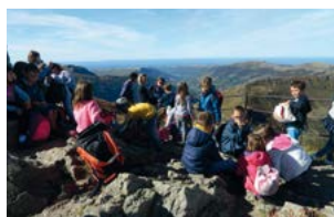
Échange scolaire : Bienvenue à la montagne !