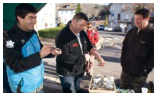
Vente d'huîtres pour les fêtes, à Champs.