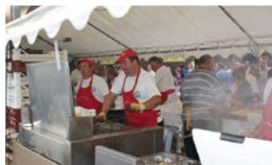
Fête de la moule, à Champs.