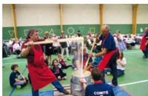
Soirée auvergnate, à la Plaine

Toute la population y est conviée pour partager et conforter notre amitié avec les Champsois.