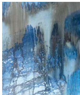
Du 3 au 28 avril CATHY LODZIAK « A LA RECHERCHE D'UNE AUTRE EXPRESSION » Peintures