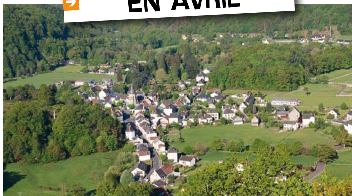
Champs sur Tarentaine-Marchal

DU 1ER AU 30 AVRIL : L'AUVERGNE EST À L'HONNEUR