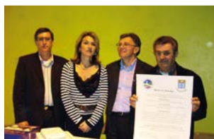
Signature de la charte le 31 Mars 2007 à Champs.